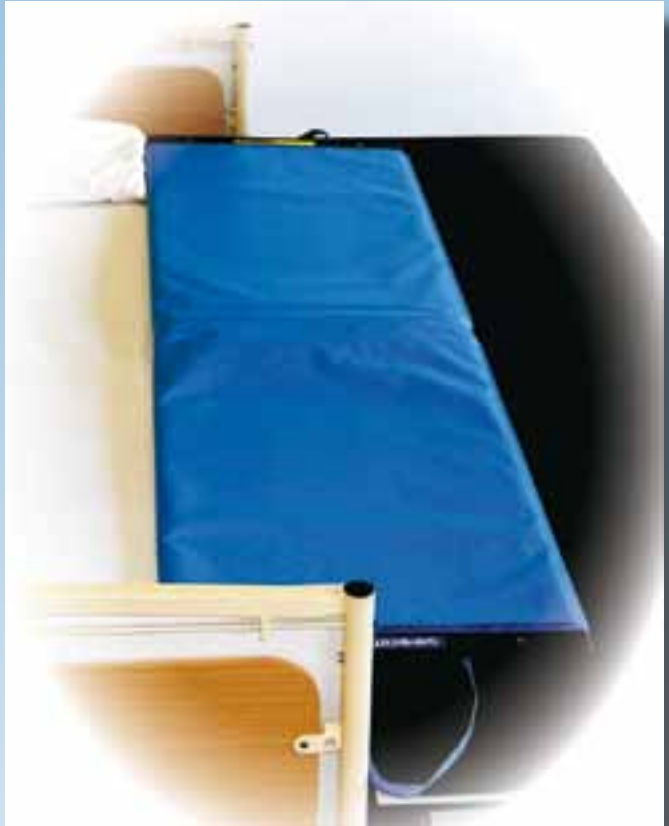
Hanse-Rollbord Junior Für den liegenden Patiententransfer