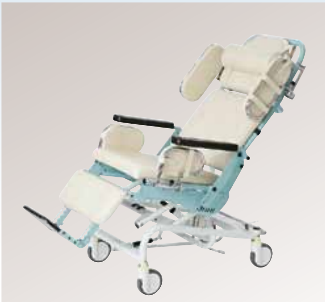
Geneigte Sitzposition Tina N.