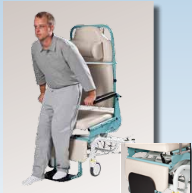
Fußtritt ist höhenverstellbar, stand-sicher sowie hochklappbar mit Arretierung.