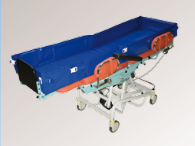
Hanse Duschmatratze für Tina (alle Modelle). Seitenteile sind für den liegenden Patiententransfer herunterklappbar.