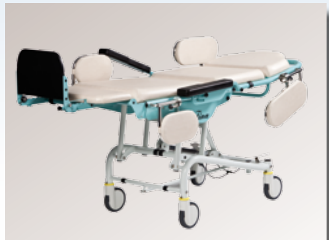
Ausstattung mit seitlichen Beinstützen und Körperhaltern. Wegklappbar für den liegenden Patiententransfer.