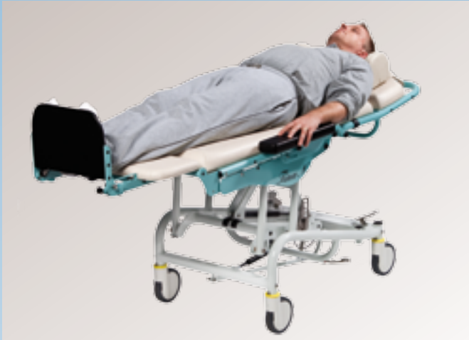
Waagerechte Liegefläche für den liegenden Patiententransfer, z. B. mit dem Rollbord Junior.